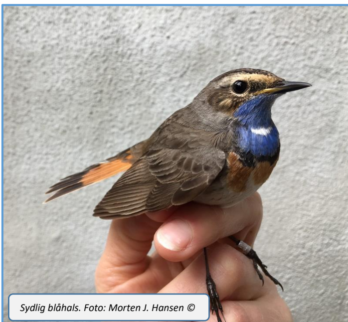
Sydlig blåhals.

Der blev fanget fire fugle med udenlandske ringe. En Fuglekonge med finsk ring, en Løvsanger med norsk ring, en Jernspurv med belgisk ring og en Gransanger med tysk ring. I skrivende stund er der indløbet melding om, at Løvsangeren fanget den 20/4 blev ringmærket i Hordaland i Norge den 28/7 i 2017 – altså for 1 år og 8 måneder siden og 971 km mod nord.