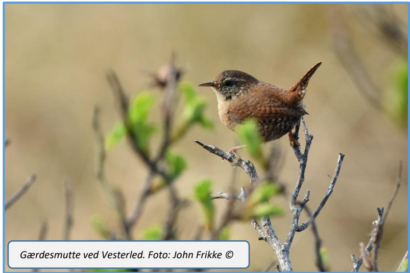
Gærdesmutte ved Vesterled.

Især april slår alle rekorder, da den tidligere aprilrekord blev begået helt tilbage i 2008 med 1.285 fugle. Det gode resultat skyldes uden tvivl det rigtigt gode ringmærkningsvejr med østlige vinde i det meste af måneden. Allerede nu er der ringmærket flere fugle end gennemsnittet for forårene samlet set.